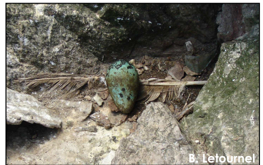
Ponte de Guillemot de Troïl découverte sur le Grand Colombier

Cette mission a permis de confirmer la nidification déjà suspectée de cette espèce sur le Grand Colombier, grâce à la découverte de 3 nids avec des adultes couvant un œuf. Les nids étaient situés dans un pierrier situés sur le versant sud de l'île (Fig. n° 6). Au vu du nombre de Guillemots de Troïl observés en mer ou posés sur le pierrier, il est possible que le nombre de couples reproducteurs soit supérieur à une dizaine de couples.