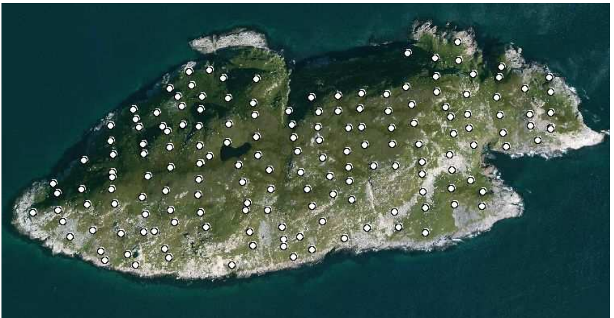
Figure 2 : positionnement des placettes d'échantillonnage des terriers d'océanites cul-blancs. Les transects suivent un axe sud-nord

L'Océanite cul-blanc, comme bon nombre de pétrels, niche en terrier : cette espèce creuse des galeries d'environ 60 cm de profondeur, pour un diamètre à l'entrée de 4 à 5 cm. Les nicheurs ne sont donc pas directement observables en surface. Le dénombrement repose donc sur les terriers, et plus précisément les entrées de ceux-ci. Au sein de chaque placette, un observateur unique procédait au dénombrement de toutes les entrées de terrier. Étaient exclus du dénombrement les doubles entrées menant au même terrier, ainsi que les galeries de campagnol ( Microtus pennsylvanicus ).