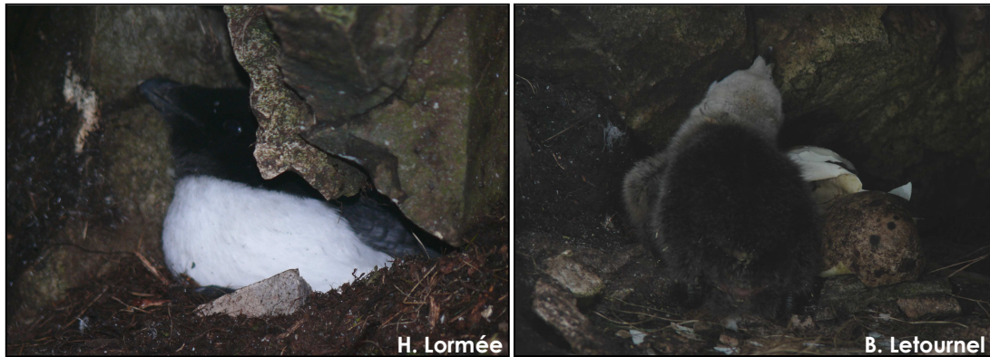
Poussins de Pingouins torda observés sur le Grand Colombier : âgés respectivement d'environ 3 semaines (à gauche), et de quelques jours (à droite)

d'estimation fiable, nos observations nous permettent d'avancer qu'au moins plusieurs dizaines de couples se reproduisent sur l'île.