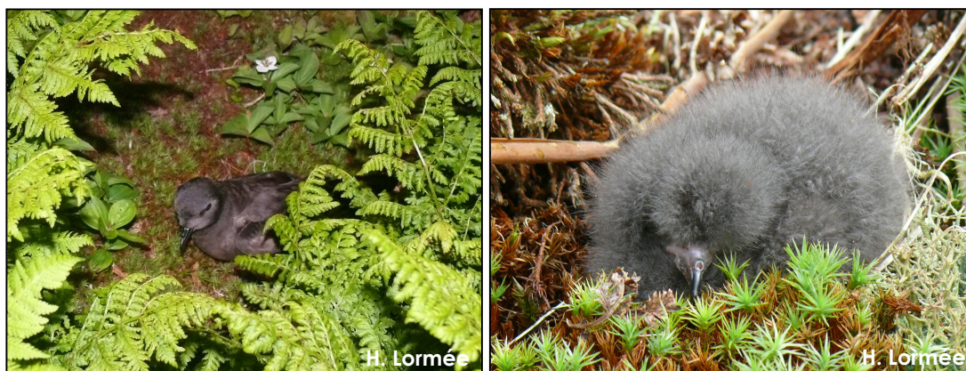
Océanite cul-blanc adulte avant sa rentrée au terrier (à gauche) et poussin d'Océanite cul-blanc thermiquement émancipé (à droite)

Nous avons contrôlé l'occupation du terrier sans chercher à déranger l'adulte pour vérifier s'il couvait un œuf ou un poussin, le stade d'avancement de la reproduction n'était donc connu que de manière très fragmentaire.