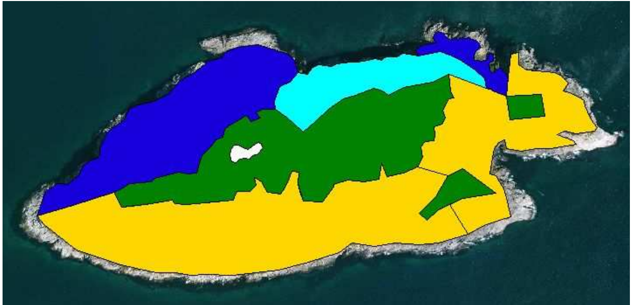
Figure 3 : cartographie des différentes zones prises en compte dans le calcul de la densité en terriers occupés pour les océanites cul-blancs : plateau (vert), pente nord (bleu foncé), zone inaccessible (bleu clair), pente sud (jaune). Les zones tidales, non utilisées par l'espèce, sont exclues du calcul. L'étang sur le plateau figure en blanc.

Estimation du taux d'occupation des terriers :