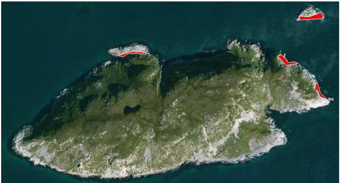
Figure 5 : cartographie des différentes colonies de Mouettes tridactyles recensées sur le Petit et Grand colombier

Le dénombrement réalisé le 10 juillet nous donne une estimation moyenne de 196 couples \pm 4.72 (Erreur standard), soit une estimation comprise dans une fourchette de 186 à 204 couples avec un intervalle de confiance de 95%. La position approximative des colonies est illustrée dans la Figure 5. Nous avons pu observer pour cette espèce simultanément des adultes sur des pontes de 3 œufs, et d'autres élevant des poussins presque totalement emplumés.