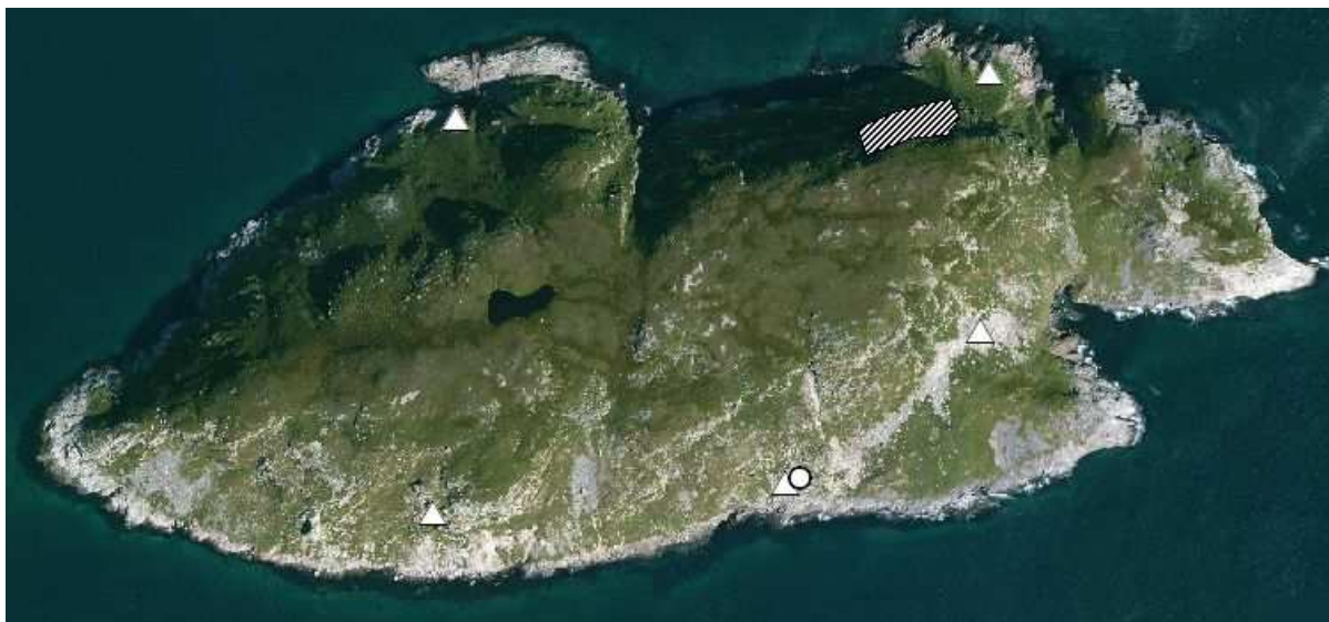
Figure 6 : emplacements approximatifs des nids de Pingouins torda (triangles blancs) et de Guillemots de Troil (rond blanc) découverts sur le Grand Colombier. La colonie de Grands Cormorans est également cartographiée (polygone hachuré).