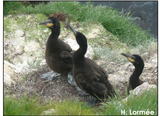
Poussins de Grands Cormorans âgés de 5 à 6 semaines

Lors de cette mission, la totalité des couples de cormorans étaient regroupés sur la face nord de l'île (Fig. n° 6). Notre estimation donne 63 \pm 1.58 couples. Nous avons pu constater un étalement important des stades de reproduction puisque certains adultes couvaient encore des pontes de 3 œufs (probablement des pontes de remplacement) tandis que d'autres élevaient des nichées de 1 à 3 poussins partiellement emplumés, âgés d'environ 5 à 6 semaines. Aucun Cormoran à aigrettes ( P. auritus ) n'a été observé dans cette colonie ou autour de l'île.